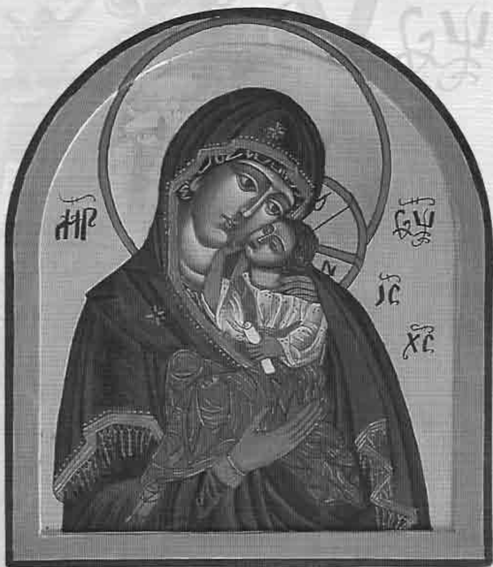
Reproducción del icono de la “Virgen de la Ternura” (siglo XII)