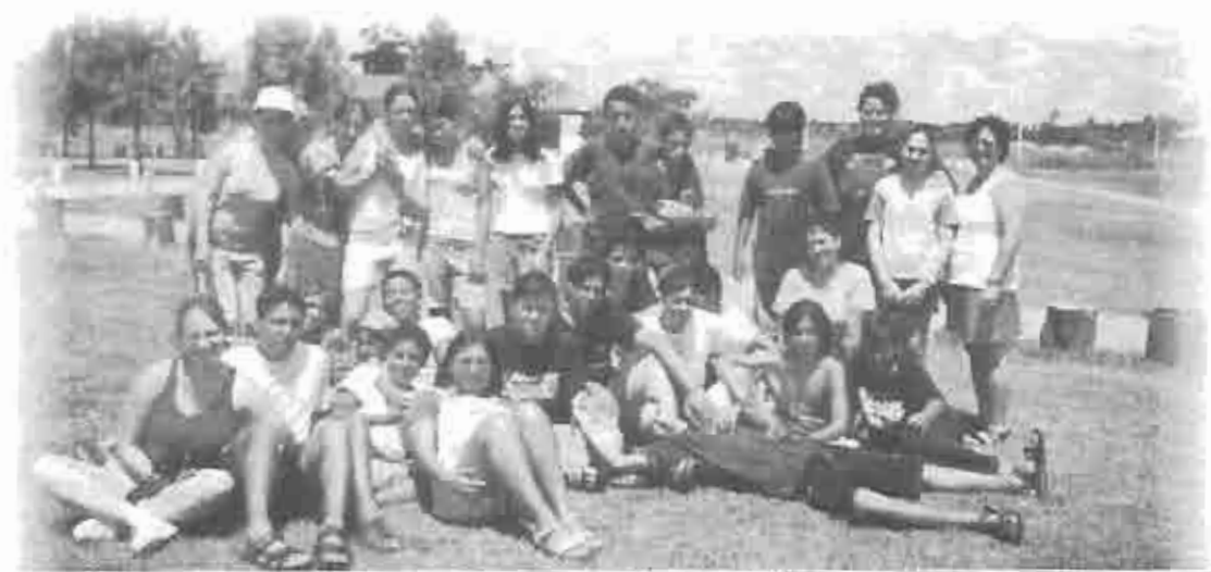
Grupo de Adolescentes en el Campamento de Verano

"Un grupo muy especial", como llamamos al grupo de los hermanos mayores de nuestra congregación tuvieron en octubre su pic-nic en las afueras de la Ciudad de Quilmes; se volverá a repetir el 29 de diciembre.