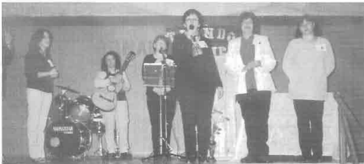
Encuentro de Mujeres de Entre Ríos - Gualeguaychú octubre de 2001