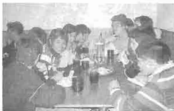
Campamento de Adolescentes en Invierno

La Escuela Dominical tiene un promedio de asistencia de 40 chicos, de los cuales la mayoría provienen de familias carentes. En esta Navidad la Iglesia recolectará regalos y juguetes para nuestros niños de la Escuela Dominical.